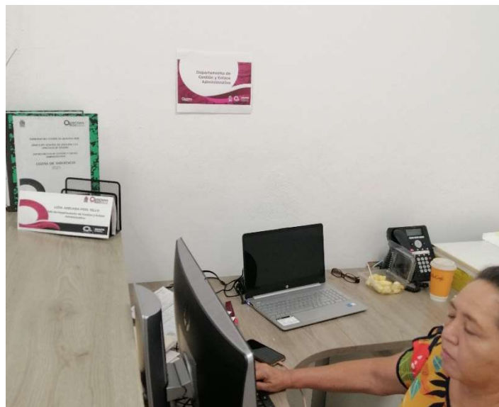
Nombre de oficina Jefatura de Departamento de Gestión y Enlace Administrativo.