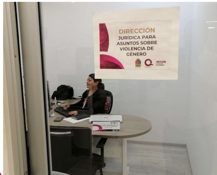
Nombre de oficina Dirección Jurídica para Asuntos de Violencia de Género.