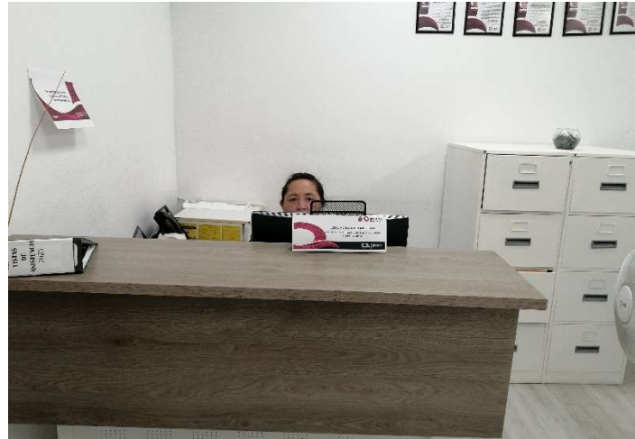
Personalizador Jefatura de Departamento de Gestión y Enlace Administrativo.