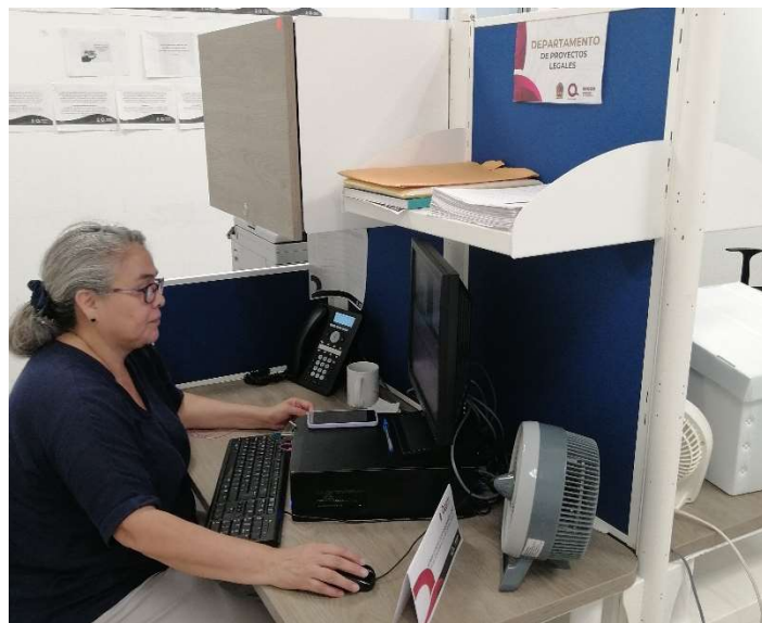
Nombre de oficina Jefatura de Departamento de Proyectos Legales.