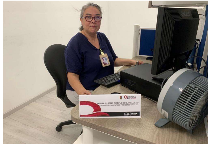
Personalizador Jefatura de Departamento de Proyectos Legales.