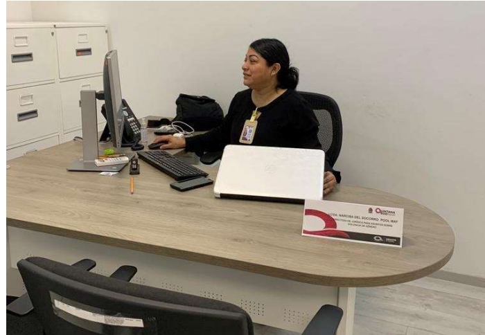
Personalizador Dirección Jurídica para Asuntos de Violencia de Género.