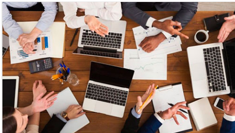
Comité de Ética y Prevención de Conflictos de Interés (COEPCI)