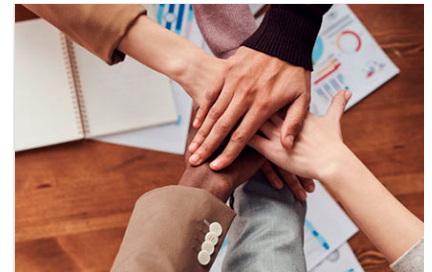
Comité de Control y Desempeño Institucional (COCODI)