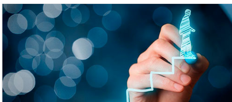
Excelencia en el Servicio Público