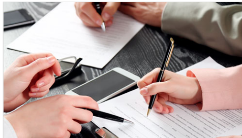
Integración del Grupo Interdisciplinario / Sistema Institucional de Archivos (GI/SIA)