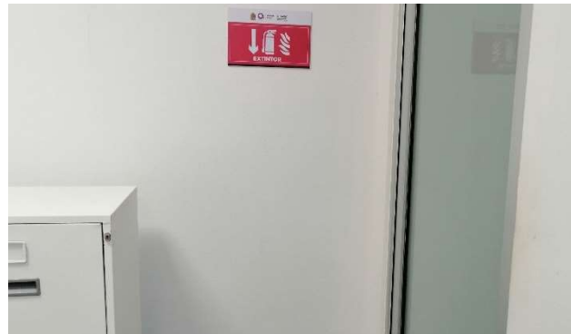
Evidencia de existencia de señalética de rutas de evacuación.