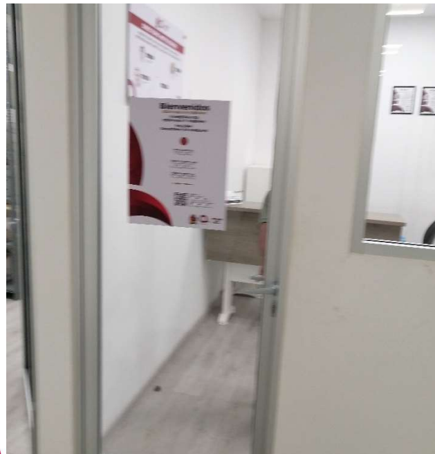
Evidencia de señalética e imagen institucional, acceso Oficinas de la DIGAVIG con horarios y días laborales.