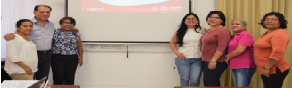
* Instalación del Comité de Ética y Prevención de Conflictos de Interés.

Quintana Roo. Con el objetivo de reforzar y promover la cultura de ética, integridad, honestidad y transparencia al interior de la Secretaría de Desarrollo Territorial (Secretaría de Desarrollo) (SEDETUS) el Comité de Ética y Prevención de Conflictos de Interés (COEPCI) realizó la "Primera Sesión Ordinaria".