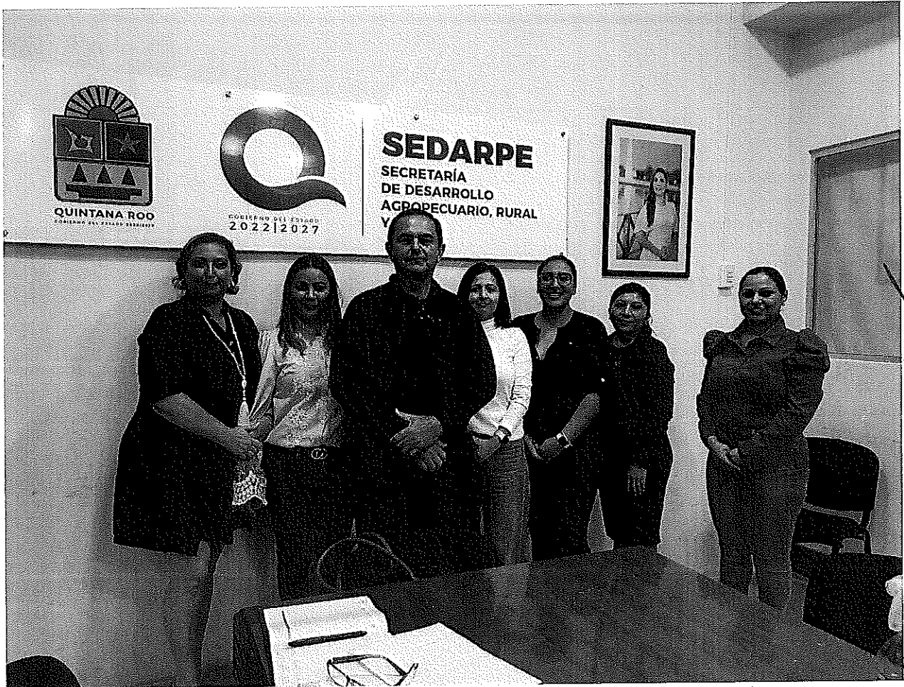
Fotografía oficial del Primera Sesión Extraordinaria del Comité de Ética y de Prevención de Conflictos de Interés (COEPCI), de la Secretaría de Desarrollo Agropecuario, Rural y Pesca